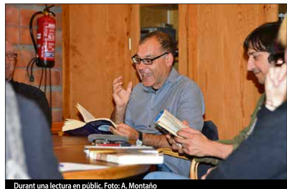
Durant una lectura en públic.