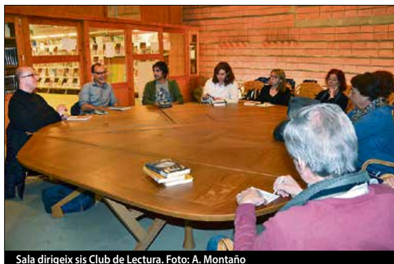
Sala dirigeix sis Club de Lectura.

Té en ment com serà el seu proper llibre? M'agradaria fer una cosa més lluminosa, escriure un llibre d'humor. ■