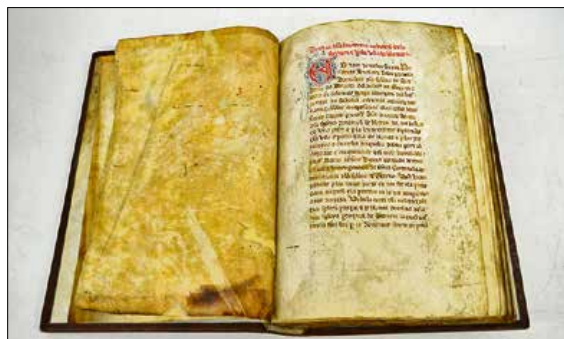
Llibre de la Universitat de la Vila de Blanes (1580).