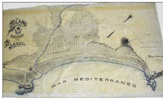
Plànol del primer Pla General de Blanes (1908).