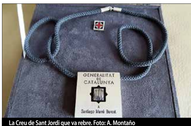
La Creu de Sant Jordi que va rebre.

Sí, em fa molta il·lusió haver rebut la medalla de la UNICA, la Unión Internationale de Cinema Non Professional. ■