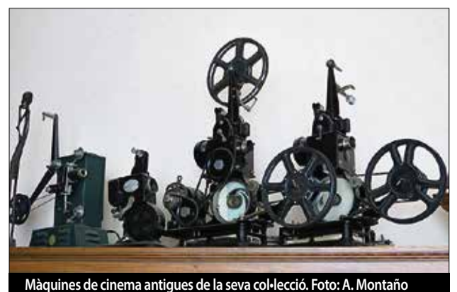
Màquines de cinema antigues de la seva col·lecció.