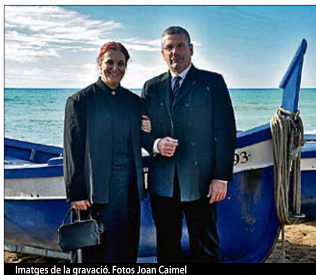
Imatges de la gravació.

El guanyador d'enguany del primer premi Vila de Pineda ha estat la cinta Shoot Granny , de Gregoine Monel i Olivier Kowalczyk. A la categoria de comèdia, el curtmetratge premiat ha estat Abre fácil , de Álvaro Carrero. El premi d'animació ha estat per Carlos Laskano per l'obra Lali . Mentre que en la categoria del públic el primer premi se l'ha emportat Mateu Ciurana per Bernadeta .