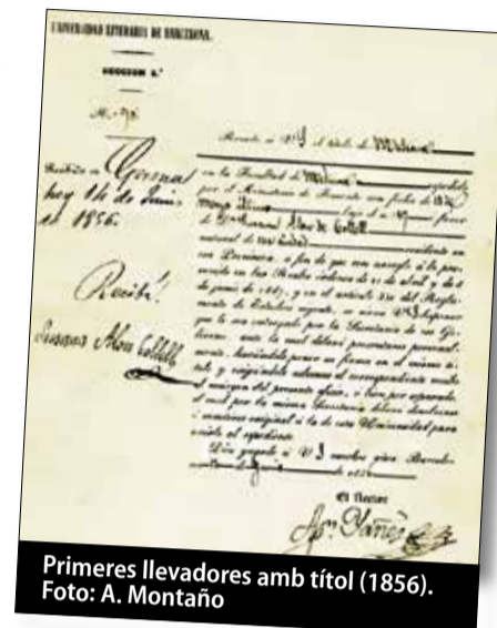
Primeres llevadores amb títol (1856).

de 1850. Va ser un procés. Primer una policia mèdica, formada per tres o quatre metges, va començar a passar per diferents ciutats rurals a fer exàmens. Anys més tard havien de passar per un Tribunal Mèdic a Barcelona per fer l'examen de Protomedicat, on havien d'explicar què sabien fer i realitzar una prova pràctica. Finalment, i davant l'allau de queixes sobre intrusisme mèdic, el Govern central es va posar més dur i va demanar el títol.