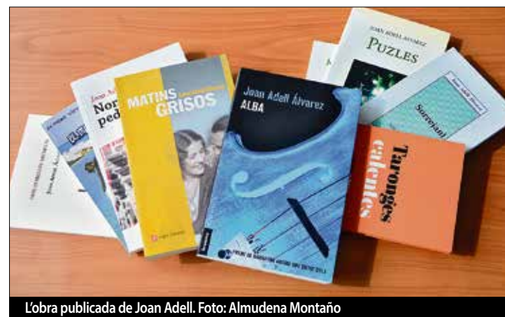
L'obra publicada de Joan Adell.

Des que va començar a escriure, la carrera editorial de Joan Adell no ha parat de donar fruits. Ha publicat les següents novel·les: El naufrag (2006), Puzles (2008), Més enllà del simulacre (2008), Matins grisos (2010), Només són pedres (2017) i Alba (2017). En l'àmbit de la poesia: Sorrejant (2006), Tres estrelles Michelin (2011) i Taronges calentes (2017); i també s'ha atrevit amb un conte: El mossèn de les putes (2007). ■